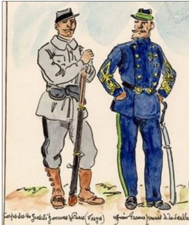
Tenues des Quarante gentilshommes de Paris (à gauche ; fond gris à distinctive noire) et officier des Francs-tireurs de la Sarthe 1 re tenue (à droite, bleu foncé à distinctive verte, galons or), telle que l'a peut-être portée Tailleuret et sous réserve du grade. Extrait d'une planche d'Henri Boisselier ( Bulletin de la Société des collectionneurs de figurines historiques , 1957/6, pl. 238) mise ultérieurement en couleur par une main anonyme.

Le 1 er (et unique) régiment de mobiles à cheval 3 , du colonel de Bourgoing, est à la fois mixte et hybride. Initié en Gironde, mais d'après la liste susdite formé à Périgueux en décembre 1870, il est un corps spécial de la garde mobile (au même titre que les ouvriers ou le génie) et considéré comme un corps-franc.