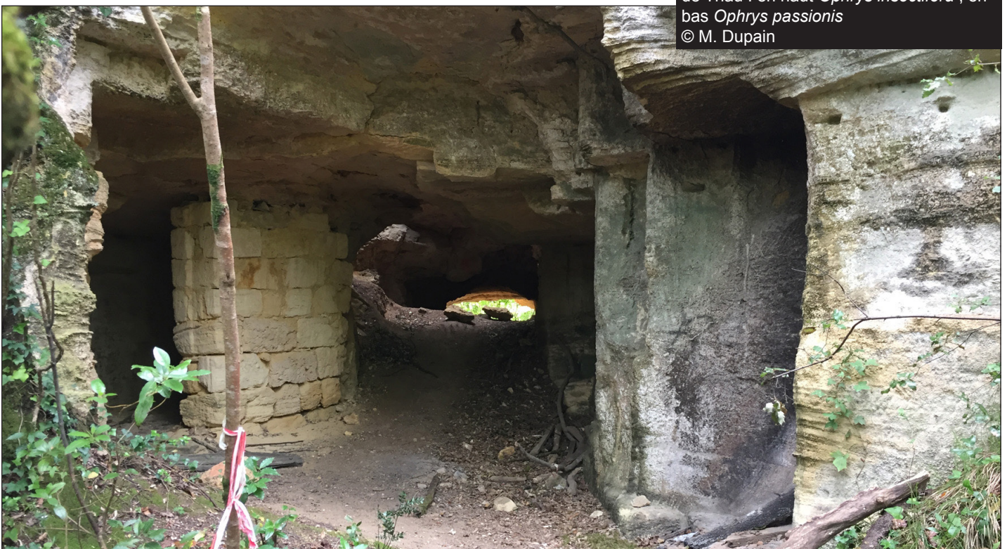
Fig. 6 - Anciennes carrières au sommet du plateau de La Roque de Thau ; elles ont exploité le «Calcaire à Astéries» ou Pierre de Bordeaux, utilisé partout pour les constructions.