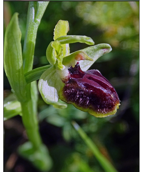
Fig. 5 - Orchidées observées à la Roque de Thau : en haut Ophrys insectifera ; en bas Ophrys passionis