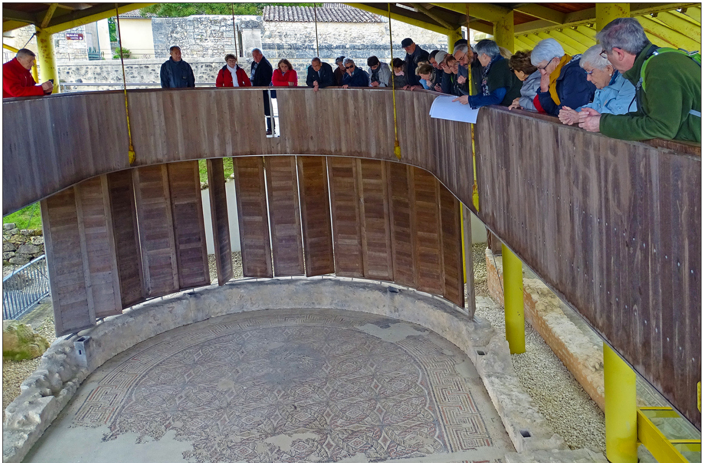
Fig. 3 - Visite de la villa romaine de Plassac et de ses belles mosaïques

fut si preux et si sage. On dépose les trois seigneurs en des tombeaux de marbre blanc. À Saint-Romain, maintenant gisent les barons ».