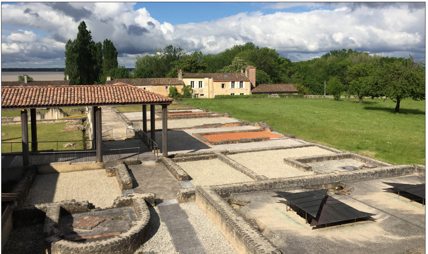
Fig. 2 - Vue générale de la villa gallo-romaine de Plassac

Blaye : notre route nous emmène pour le déjeuner vers la citadelle de Blaye, au son de l'Avis de Vauban sur le Bâtiment et les entrepreneurs de son temps, d'une grande modernité encore aujourd'hui. Malheureusement, la pluie menace et le gel a frappé la nuit précédente les vignes de nos restaurateurs, désorganisant quelque peu le service, et nous regretterons de n'avoir pu déjeuner dehors... Les poètes et les vins du terroir nous accompagnent, Chanson de Roland dans la chronique du pseudo-Turpin (XIII e s.), « Sur de grandes nefes, Charles traverse la Gironde. Il conduit jusqu'à Blaye le corps de son neveu, celui d'Olivier le noble compagnon de Roland, celui de l'Archevêque qui