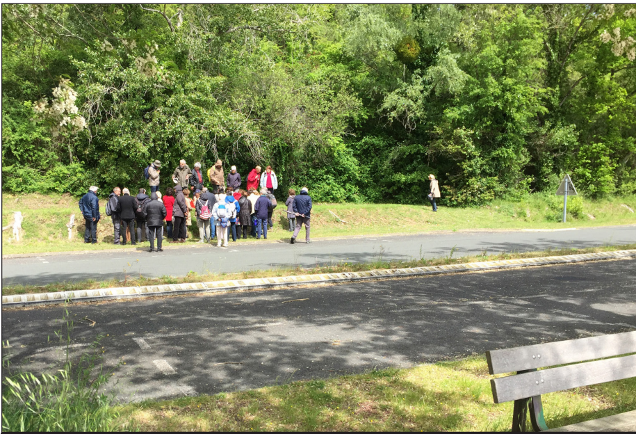
Fig. 4 - Le groupe à la recherche des Orchidées au pied de la colline de La Roque de Thau à Gauriac ; on a observé ici Ophrys apifera , Ophrys passionis , Himantoglossum hircinum ...

Ces coteaux qui furent jadis exploités (pierres de taille, dépôt militaire) ont été reconquis par une végétation maintenant bien établie.