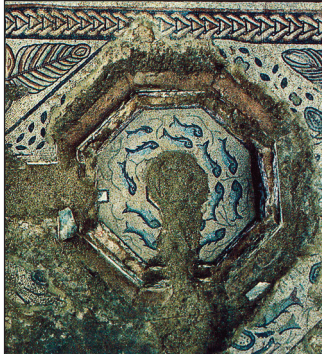
Fig. 3. – Le bassin aux poissons.

Un jardin d'agrément et un grand bassin ornemental, de soixante mètres de long sur sept de large, précèdent une galerie péristyle qui s'étend sur quatre-vingt-dix mètres (fig. 2). En son centre, elle donne accès à une vaste salle de réception, qui possède un bassin alimenté par des canalisations en plomb. Y dansent, sous un jet d'eau, les poissons bleus de la mosaïque (fig. 3). De part et