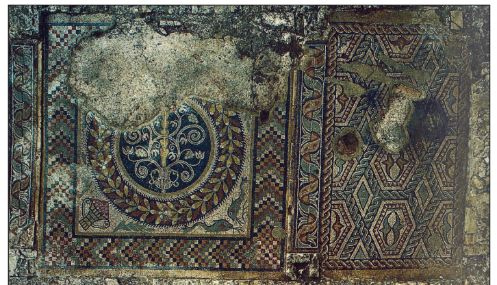
Fig. 4. – Mosaïque de la chambre aux deux alcôves, avec des pampres de vigne stylisés.

Pierre RÉGALDO-SAINT BLANCARD président de la Société archéologique de Bordeaux