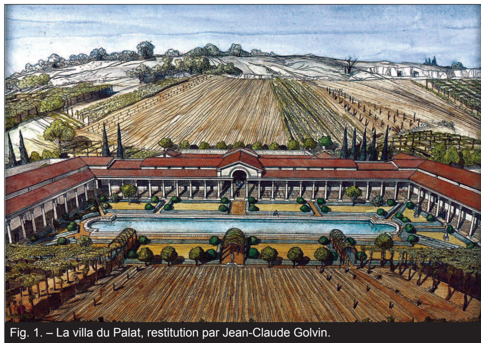
Fig. 1. – La villa du Palat, restitution par Jean-Claude Golvin.

Bien que Jouannet évoque dès 1820 différents éléments gallo-romains à Saint-Émilion, le site archéologique du Palat n'est guère connu que depuis 1936 et la synthèse proposée par Ch. Ouy-Vernazobres. Mais en 1969, à la faveur de travaux, le comte Léo de Malet le redécouvrit. Marc Gauthier (DAHA 1 ) y mena des fouilles jusqu'en 1971, puis Catherine Balmelle (CNRS) de 1981 à 1988 ; en 1991, une prospection au géoradar compléta les données. Depuis 2013, Catherine Petit-Aupert (Université Bordeaux-Montaigne) a mené de patientes prospections au sol, comme dans une bonne partie de Saint-Émilion et des communes alentour, re-