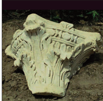
Fig. 5. – Chapiteau retrouvé en fouille.

d'autre de cette salle se trouvent différentes installations domestiques et en particulier, au sud, une pièce à deux alcôves symétriques, où l'on verrait bien la chambre du maître de maison. Sur le sol mosaïqué, s'épanouissent des rinceaux de vigne qui jaillissent d'un cratère (fig. 4). On imagine volontiers une évocation de l'origine de la fortune du propriétaire ; mais l'actualité de ces connotations ne peut qu'appeler à la prudence.