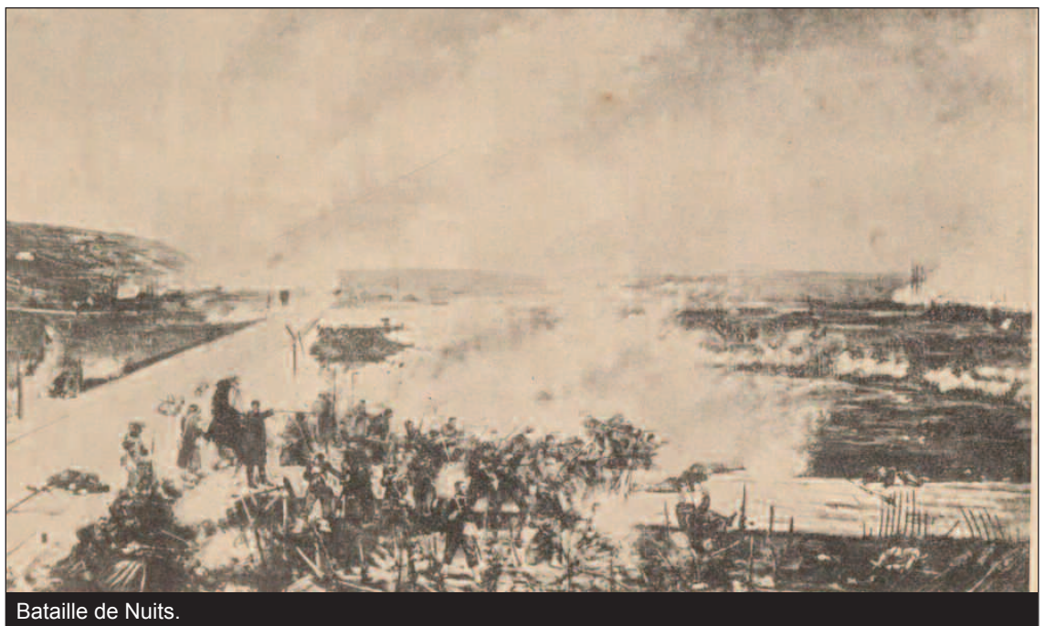
Bataille de Nuits.