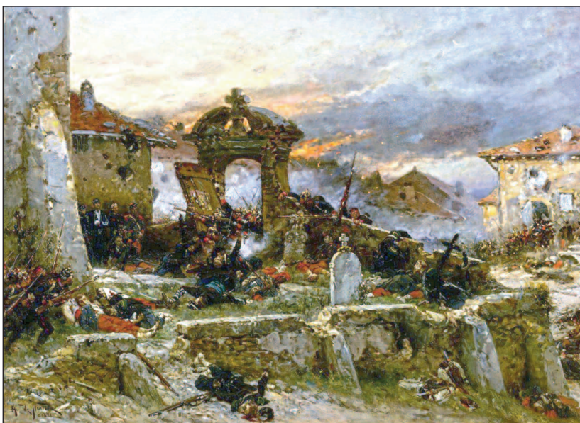
Le cimetière de Saint-Privat (18 août 1870) par Alphonse de NEUVILLE (1881), Musée d'Orsay.

1. Cet article s'insère dans un projet de recherche mené par le Centre généalogique du Sud-Ouest en vue du cent-cinquantième de la guerre de 1870-1871, plus particulièrement centré sur le personnel du V e bataillon des mobiles de la Gironde, des Tirailleurs girondins et des Francs-Tireurs commandés par Tailleuret, l'historique de ces corps, et de façon plus générale le vécu de la guerre à Bordeaux, et les traces mémorielles de toutes sortes pouvant être recensées sur le territoire du département de la Gironde et des lieux de combats où furent présentes les unités girondines. Toute information, contribution ou aide est la bienvenue. Un deuxième article traitant plus spécifiquement des mobiles, mobilisés et corps-francs girondins paraîtra dans la livraison de mai-juin (J.-P. C.).