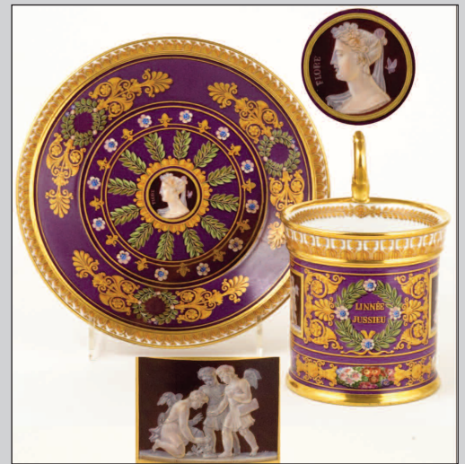
7. Objets en porcelaine de la duchesse de Berry en 1829 [Collection du musée des Arts décoratifs et du Design de Bordeaux. (C) Mairie de Bordeaux. Photo Lysiane Gauthier].

Bulletins puis Actes de la SLB, débutant en 1826 et se poursuivant de nos jours (tome 153 en 2018), dont l'ensemble forme un véritable monument dans la connaissance des sciences naturelles et de la biodiversité régionale(s). Laterrade, directeur à vie de la SLB jusqu'à son décès en 1858, fut vraiment la cheville ouvrière de la Société, se montrant très actif et dévoué pendant 40 ans ; botaniste averti, il publia quatre éditions de sa Flore bordelaise , et se permit de proposer en 1824 un système périanthel de classification végétale (basé sur calice et corolle), mais qui ne fut pas suivi par les auteurs.