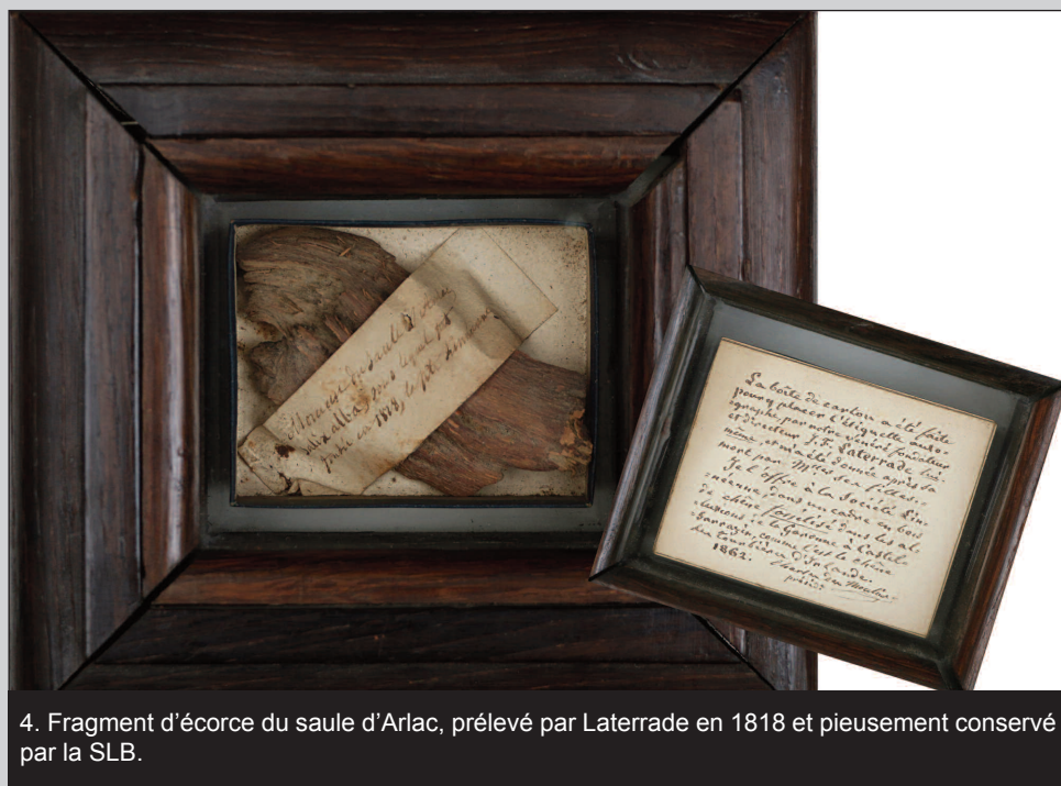
4. Fragment d'écorce du saule d'Arlac, prélevé par Laterrade en 1818 et pieusement conservé par la SLB.