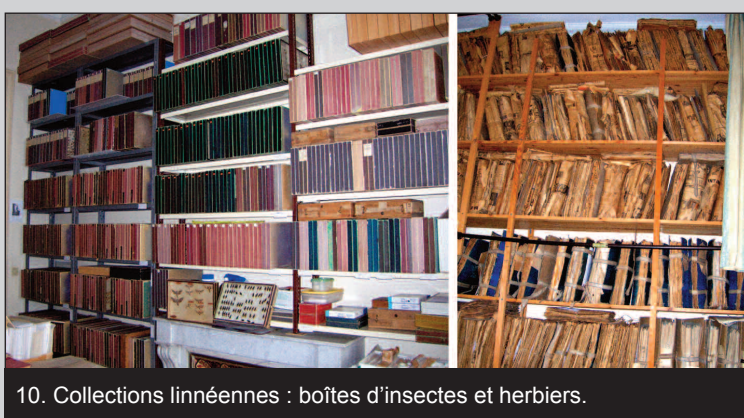
10. Collections linnéennes : boîtes d'insectes et herbiers.