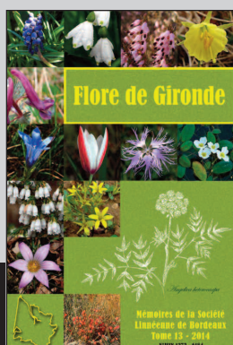
9. Mémoire publié par la SLB (Tome 13, 770 p.).