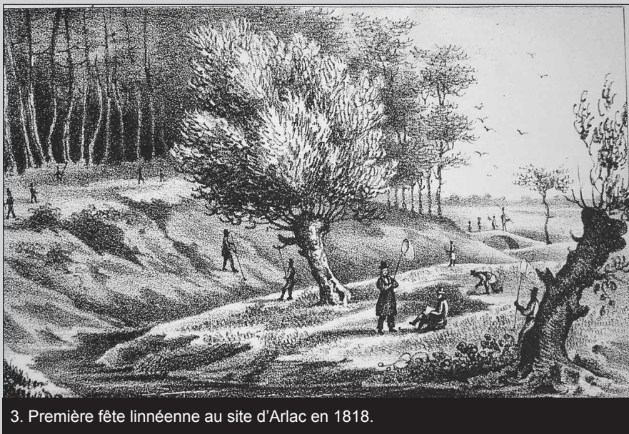
3. Première fête linnéenne au site d'Arlac en 1818.