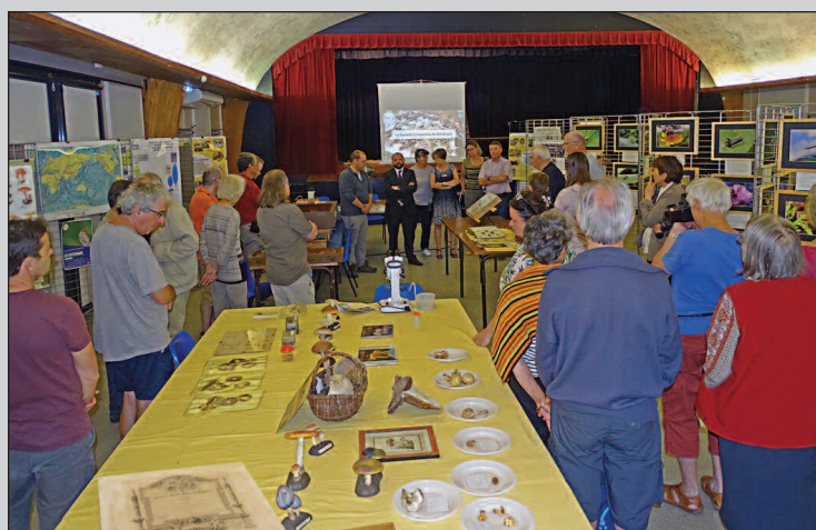
8. 200 e Fête linnéenne à Bouliac, 23-06-2018 ; exposition et discours. Exemple de panneau de section (Géologie).