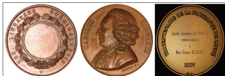
1. Médailles en bronze à l'effigie de Linné : (à gauche) frappée au XIX e siècle pour la Societas Linnaeana burdigalensis ; à droite lors du tricentenaire linnéen en 2007 (médaille offerte lors du jubilé des Linnéens = 50 ans de sociétariat).

« Prince de la botanique », « Pline du Nord », « Second Adam »..., voilà des surnoms donnés à Charles Linné (1707-1778), anobli en 1757 en Carl von Linné (Fig. 1). Pour lui, classer, décrire et nommer sont les fondements de la science naturaliste. Il est un observateur et un descripteur exceptionnel des choses de