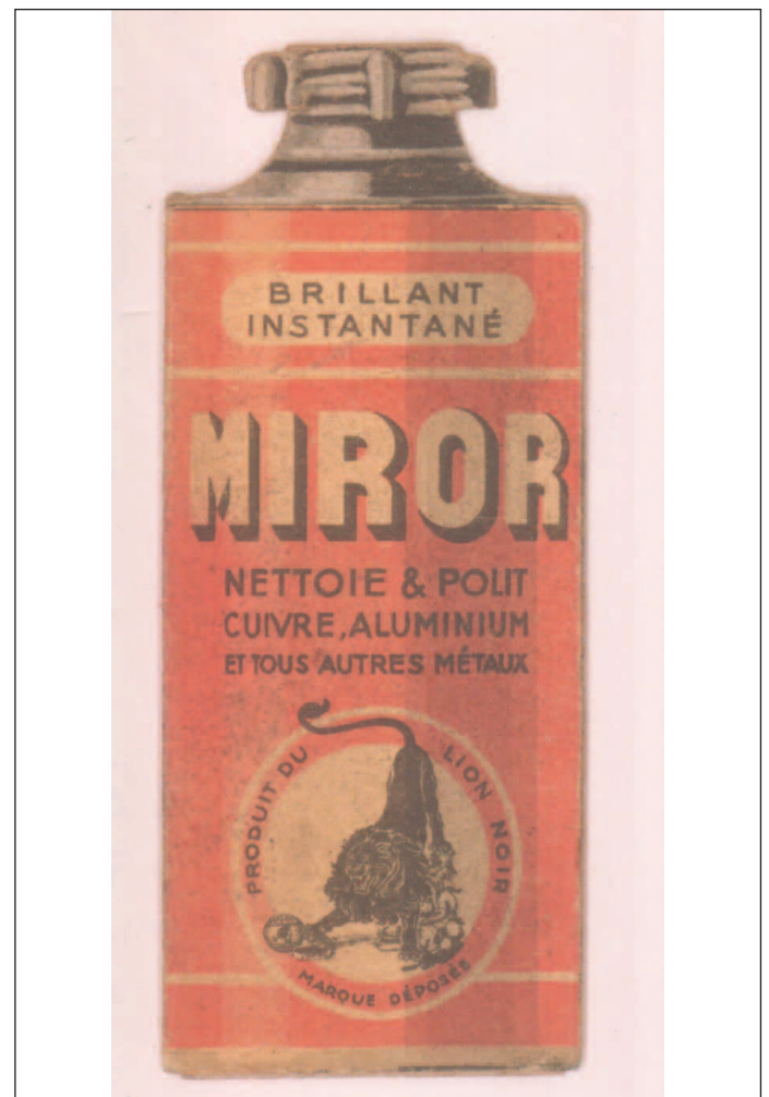
Fig. 3/ Publicité à système éditée par une marque de produit abrasif. Quand on tire sur le bouton du haut apparaît une table de multiplication.