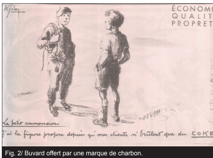
Fig. 2/ Buvard offert par une marque de charbon.