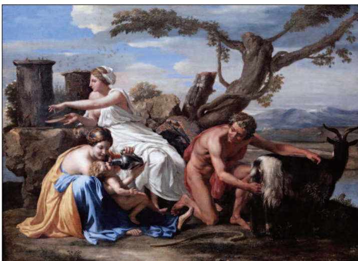
Nicolas POUSSIN, Jupiter enfant nourri par la chèvre Amalthée , 1638. La nymphe Mélissa prélève pour lui du miel des ruches d'Aristée, le premier apiculteur.