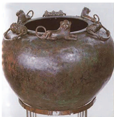
Chaudron à hydromel, 1 m de diamètre, 500 litres de contenance

Archéologue et directeur de recherche émérite au CNRS, Fanette Laubenheimer (2015) présente l'hydromel comme : « la plus simple des boissons alcoolisées, du miel et de l'eau, deux produits naturels qu'il suffit de laisser fermenter avec de la chaleur. Un essaim abandonné dans la forêt se serait rempli d'eau de pluie et le mélange aurait naturellement fermenté. Des chasseurs de la préhistoire passant par là auraient goûté ce breuvage et se seraient régalez.