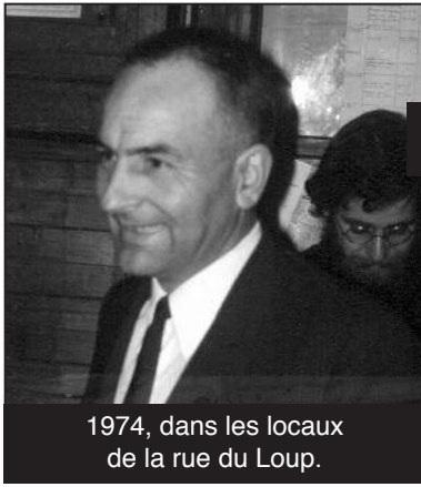
1974, dans les locaux de la rue du Loup.